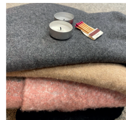
Vorbereitung für den Stromausfall