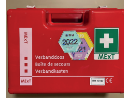
Erste Hilfe im Notfall

Vorsorge und Verhalten bei Stromausfall, Hochwasser und Sturm