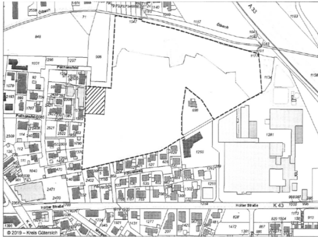
Lageplan 1: Gelände ehemaliger Campingplatz

----- Grenze des räumlichen Bereiches ehemaliger Campingplatz am Föhrenweg [Schraffierte Fläche] Fläche für Flüchtlingsunterkunft