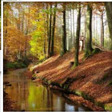
Im Herbst leuchtet der Ölbach in bunten Farben. Wandern geht einfach immer!

Diese Wanderung führt Sie durch das Naherholungs- und Naturschutzgebiet Holter Wald.