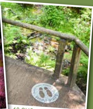
18 SHS-Selfie-Points finden Sie auf den Touren.