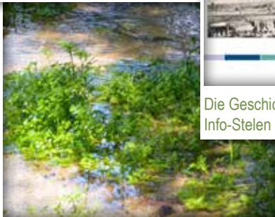
Der Weg überquert 2 der 10 Senneebäche: Westerholter Bach und Ölbach.

Historische Karten, Zeichnungen, Dokumente und Fotos zeigen Ihnen auf diesem Spaziergang durch den Ort anschaulich die Entwicklung des Ortsteils Stukenbrock.