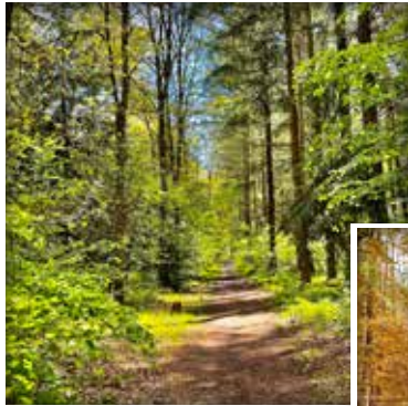
Der Holter Waldweg ist größtenteils naturbelassen.