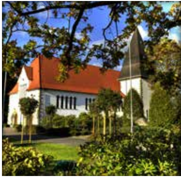
Die Liemker Kirche St. Joseph strahlt Erhabenheit aus.