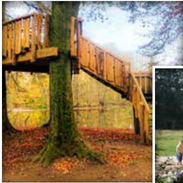
Von der Aussichtsplattform Wald und Teich entdecken.