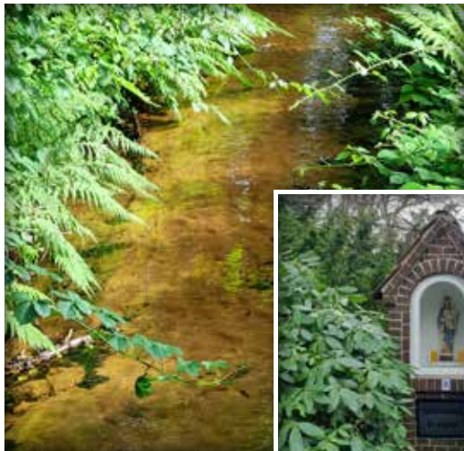
Auch den Heiligenhäuschenweg begleiten mehrere Sennebäche.