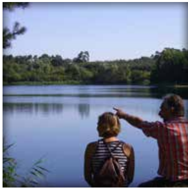
Der Senne-See lädt zum Entspannen und Beobachten ein.