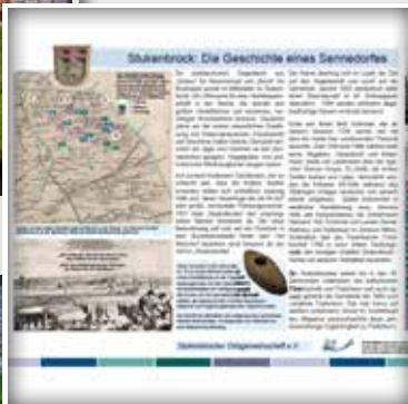
Die Geschichte Stukenbrocks wird an Info-Stelen anschaulich erklärt.