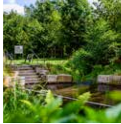
Eine Wohltat: Wassertreten an der Wapelaue in Liemke