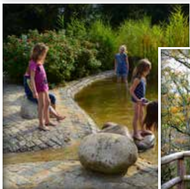
Die Ems-Erlebniswelt ist ein lohnenswertes Ziel!