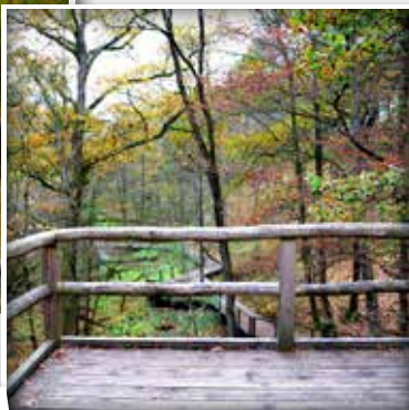
Die Emsquelle lässt sich direkt vom Besuchersteg aus beobachten.