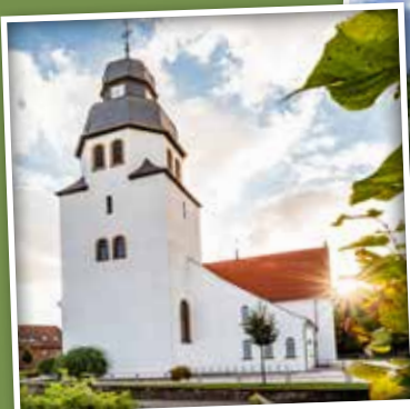
Kultur, Natur oder beides. Die Wanderungen in SHS sind vielfältig.