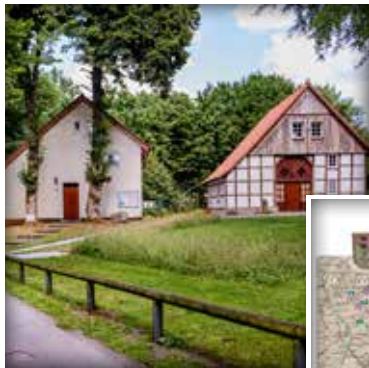
Start des Weges ist an den drei Heimathäusern in Stukenbrock.