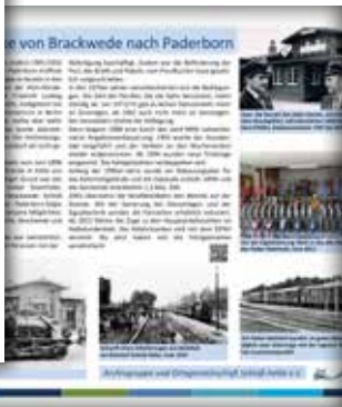
Den Bahnhof von 1901 gibt es sogar als H0-Modell im Rathaus zu sehen!