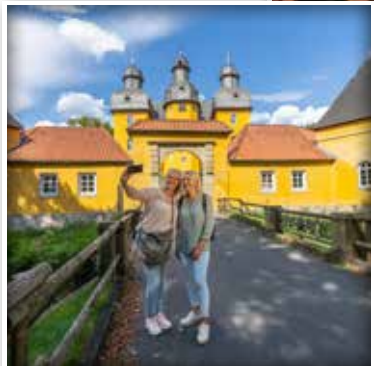
Das Jagdschloss ist über 400 Jahre alt und hat eine bewegte Geschichte.