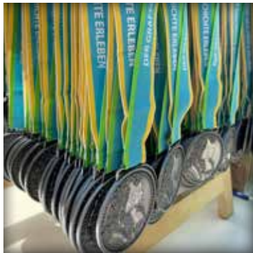
Die Medaille des Lauf-Events ist einer alten Münze nachempfunden.