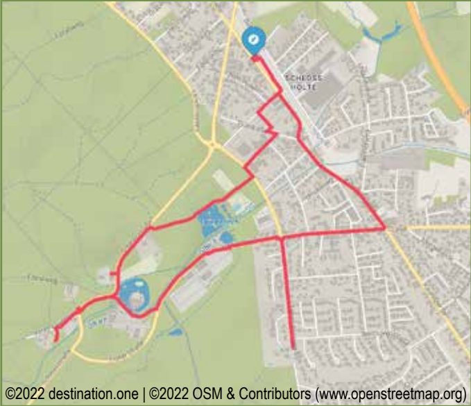
©2022 destination.one | ©2022 OSM & Contributors (www.openstreetmap.org)

Start & Ziel Bahnhof Schloß Holte, Bahnhofstraße 1, Schloß Holte