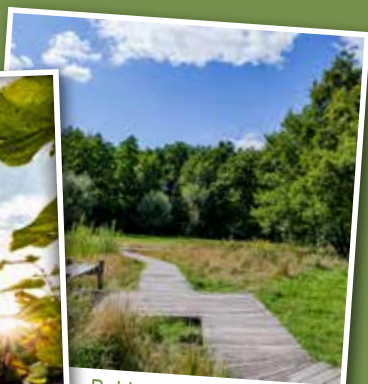
Bohlenweg am Erlebnispfad Holter Wald.