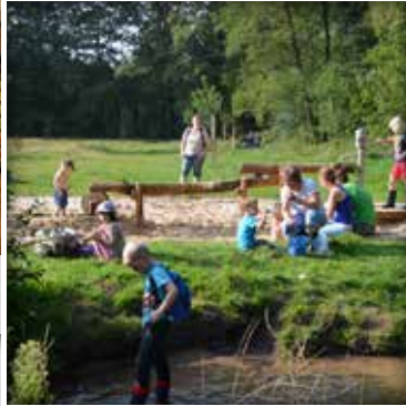
Der Wasserspielplatz mit Bach-Anschluss lässt Kinderherzen höher schlagen!