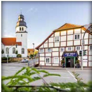
Das Ortszentrum Stukenbrock beeindruckt mit historischen Gebäuden.