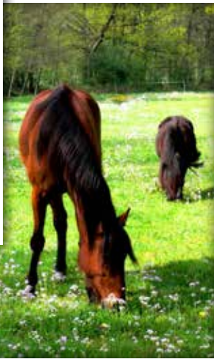
Pferde sind hier fast immer zu sehen. Auf den Weiden, dem Reitplatz oder auf dem Reitweg um den See.