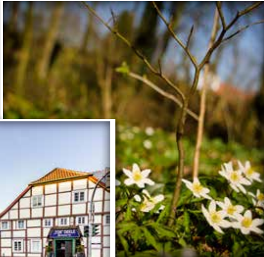
Buschwindröschen am Wegesrand zu den Heimathäusern.