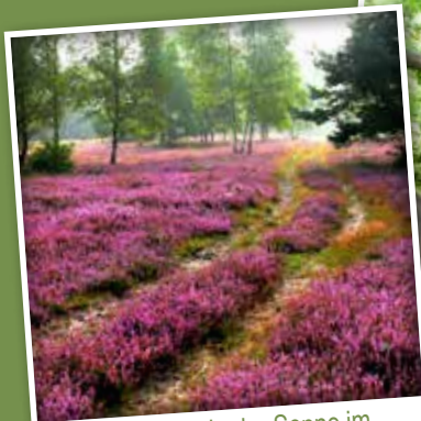
Die Heidenblüte in der Senne im Spätsommer ist ein echtes Highlight!