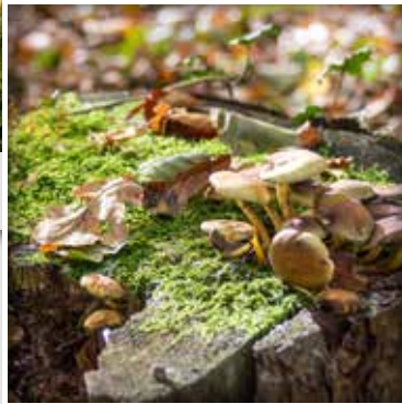
Stilleben voller Leben - am Schlossweg überall zu finden!

Der Schlossweg führt größtenteils durch den Holter Wald. Er verbindet das Jagdschloss Holte mit Verl.