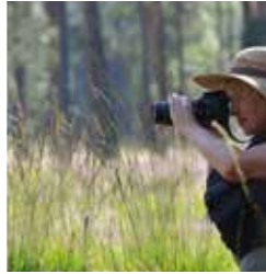
Tolle Foto-Motive, beispiels- weise das Heimathaus links