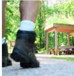
Pause genießen: Schutzdach an der Emsquelle

Erkunden Sie die wunderschöne Senne am Fuße des Teutoburger Waldes! Von der Zeitreise bis zum Stadtspaziergang, vom „Romantischen Furlbachtal“ bis zur Emsquelle!