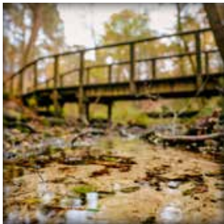
Die Emsquelle SHS ist ein toller Ort im Naturschutzgebiet Moosheide.

Als Naturtour zertifiziert ist das „ Romantische Furlbachtal “. Der Furlbach gilt als einer der schönsten Sennebäche. Das tief in die Sanddünen eingeschnittene Tal sollten Sie unbedingt erwandern - auf gewundenen Pfaden durch den abwechslungsreichen Wald!