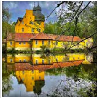
Das Jagdschloß Holte ist Namensgeber für die Stadt.

Deutschlandweit bekannte Ausflugsziele wie das Safariland Stukenbrock, Sehenswürdigkeiten wie das Jagdschloß Holte und ein attraktives Touren-Netz durch wunderschöne Natur machen den Aufenthalt in SHS abwechslungsreich.