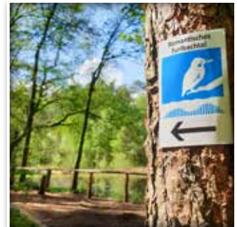
Die Wanderwege in SHS sind in beide Richtungen ausgemalbt.

Die Marke Senne Original mit Wild, Honig, Kartoffeln und mehr ist inzwischen „in aller Munde“.