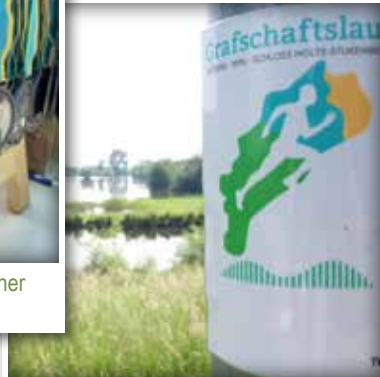
Entlang des Steinhorster Beckens führt der Weg von Rietberg über Verl nach SHS.