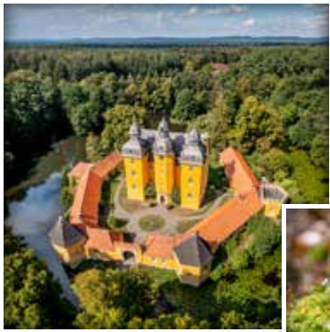
Das markante Holter Jagdschloss: Ausgangspunkt des Schlosswegs.