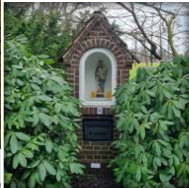
Wegbild der Muttergottes auf dem großen Heiligenhäuschenweg.

Dieser Weg südlich der Kirche führt Sie durch die weite Landschaft. Felder und Wiesen dominieren die Flur. Sie überqueren auf der Wanderung den Rahmke- und den Sennebach und damit zwei der 10 Bäche, die durch SHS fließen.